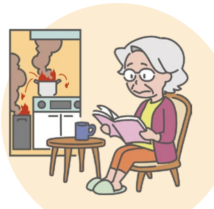
キッチンの火を止め忘れて、火事になりかけるが気が付かない